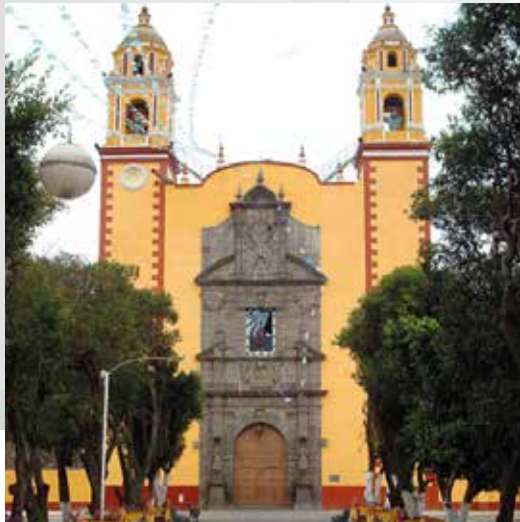
Parroquia de San Andrés Apóstol Cholula y Ex Convento

CALLE 3 ORIENTE NÚM. 02 (FRENTE A PALACIO MUNICIPAL)