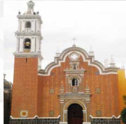
Parroquia de San Bernardino Tlaxcalancingo

CALLE 3 ORIENTE NÚM. 02 (FRENTE A PALACIO MUNICIPAL)