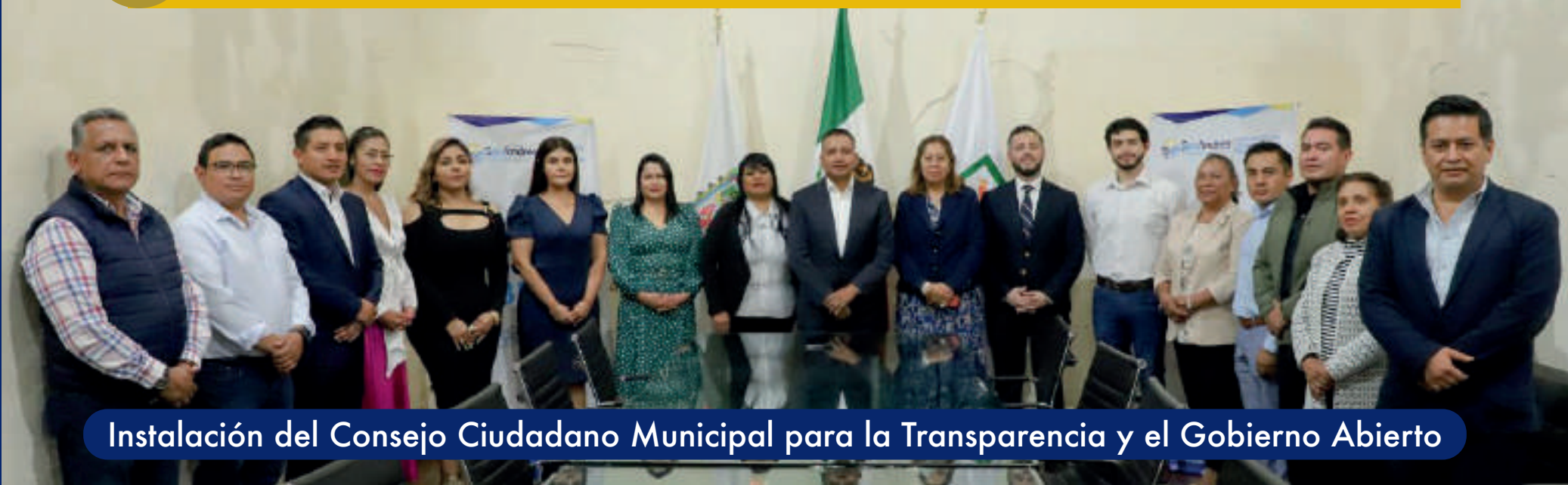
Instalación del Consejo Ciudadano Municipal para la Transparencia y el Gobierno Abierto