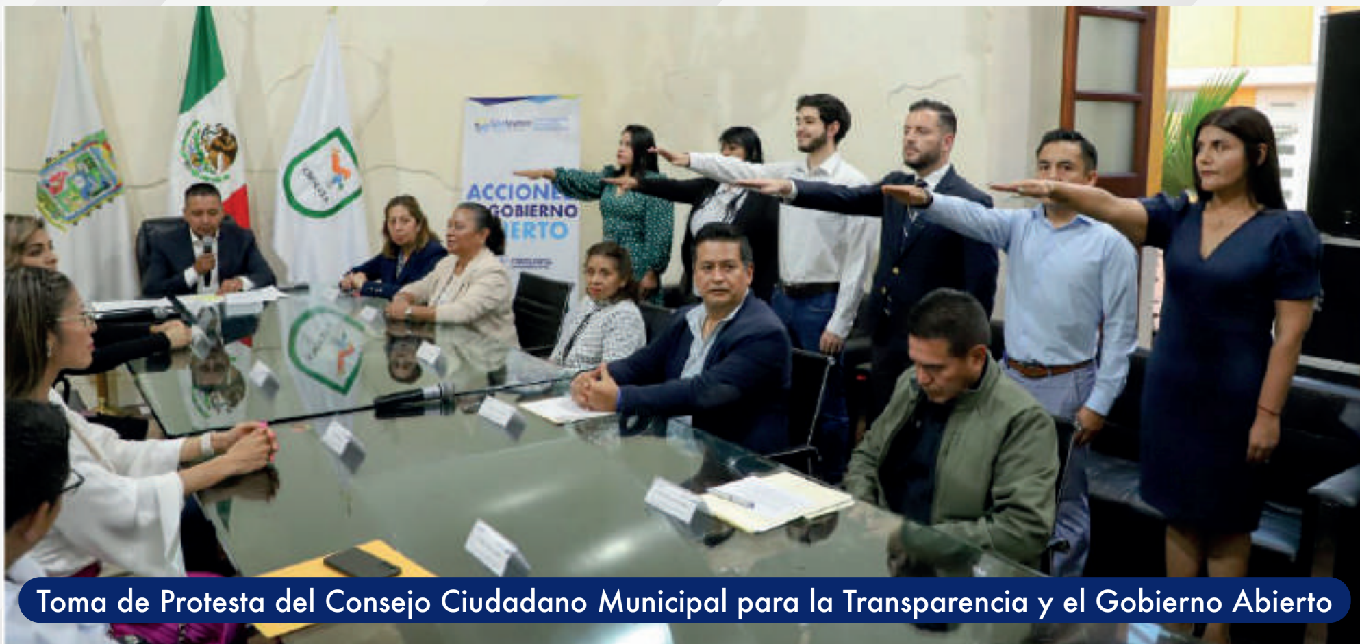
Toma de Protesta del Consejo Ciudadano Municipal para la Transparencia y el Gobierno Abierto